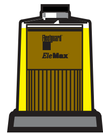
Готовность к замене

В то время как уровень топлива в фильтре остается в нижней половине фильтрующего элемента, топливо все еще проходит через чистый, новый фильтрующий материал.