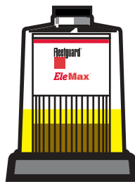
Уровень топлива остается на уровне ниже половины фильтрующего элемента

Уровень топлива в Fuel Pro первоначально устанавливается ниже нижней половины фильтрующего элемента. Фильтр создает минимальное сопротивление. По мере работы загрязнение забивает фильтр, заполняя сначала нижнюю часть. Уровень топлива поднимается в фильтре, показывая оставшийся срок его службы.