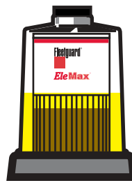
Сопротивление для проходящего потока дизеля постоянно остается низким

По мере улавливания загрязнения фильтром, уровень топлива поднимается над уровнем собранной грязи и топливо протекает через чистый фильтрующий материал, что обеспечивает низкое сопротивление для проходящего потока дизеля.